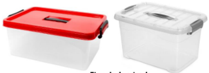
Ejemplo de cajas de 10 litros