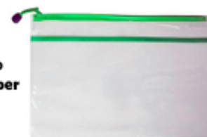
Sobre plástico grande con zipper