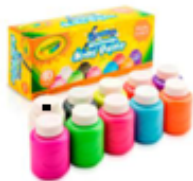
Tempera crayola de frascos y canvas o lienzo para pintar