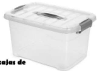
Ejemplo de cajas de 10 litros