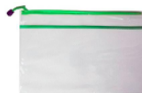
Sobre plástico con zipper grande