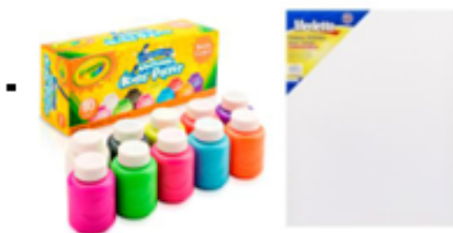
Tempera crayola de frascos y canva o lienzo para pintar